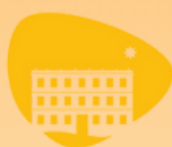
Harinera del Guadaíra Centro Turístico