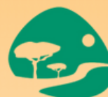
Centro de Turismo Sostenible Riberas del Guadaíra