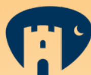
Centro de Interpretación Castillo del Guadaíra