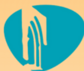
Centro San Miguel Castillo del Guadaíra